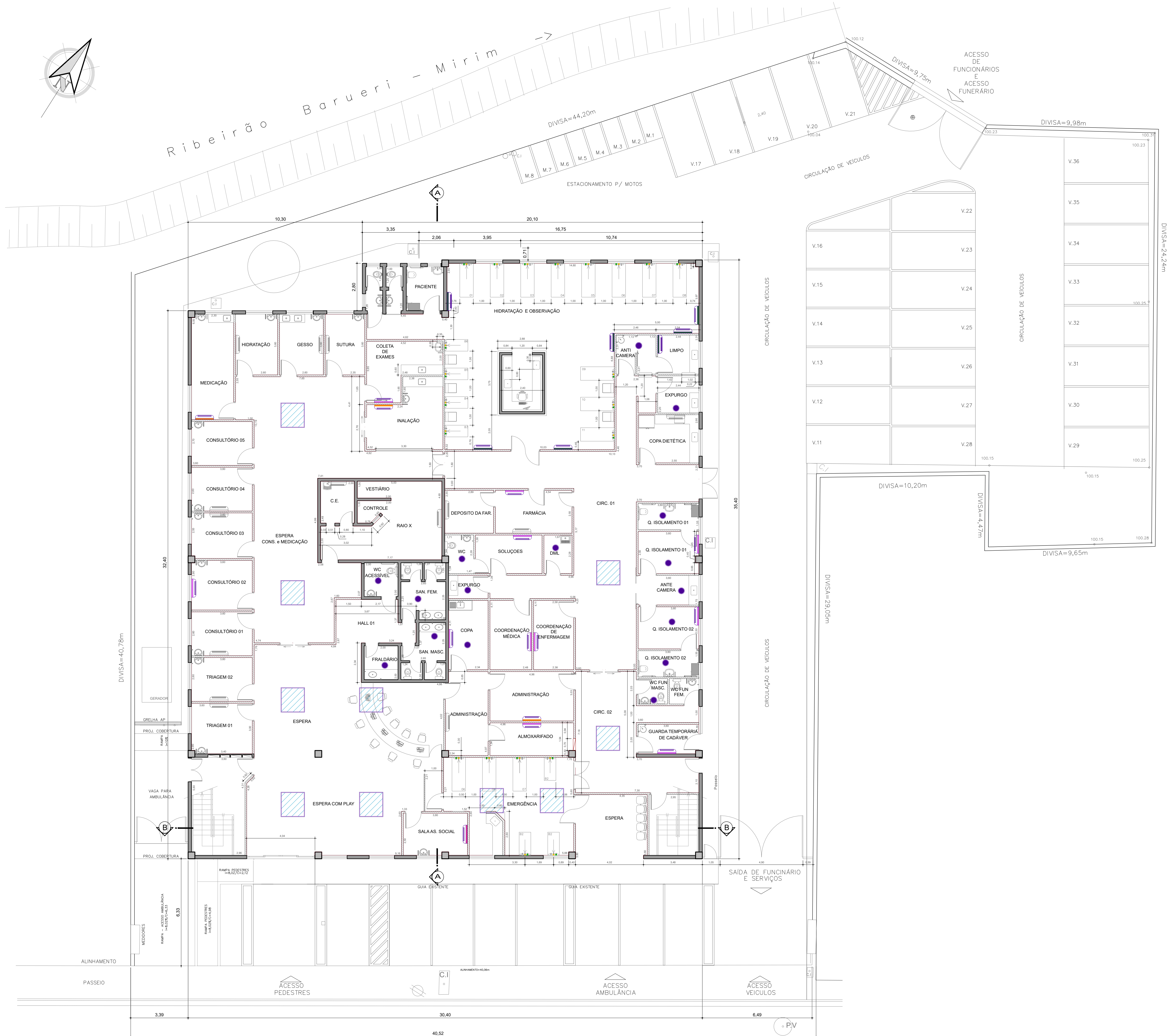
PLANTA BAIXA TÉRREO - AR CONDICIONADO ESC.: 1:100